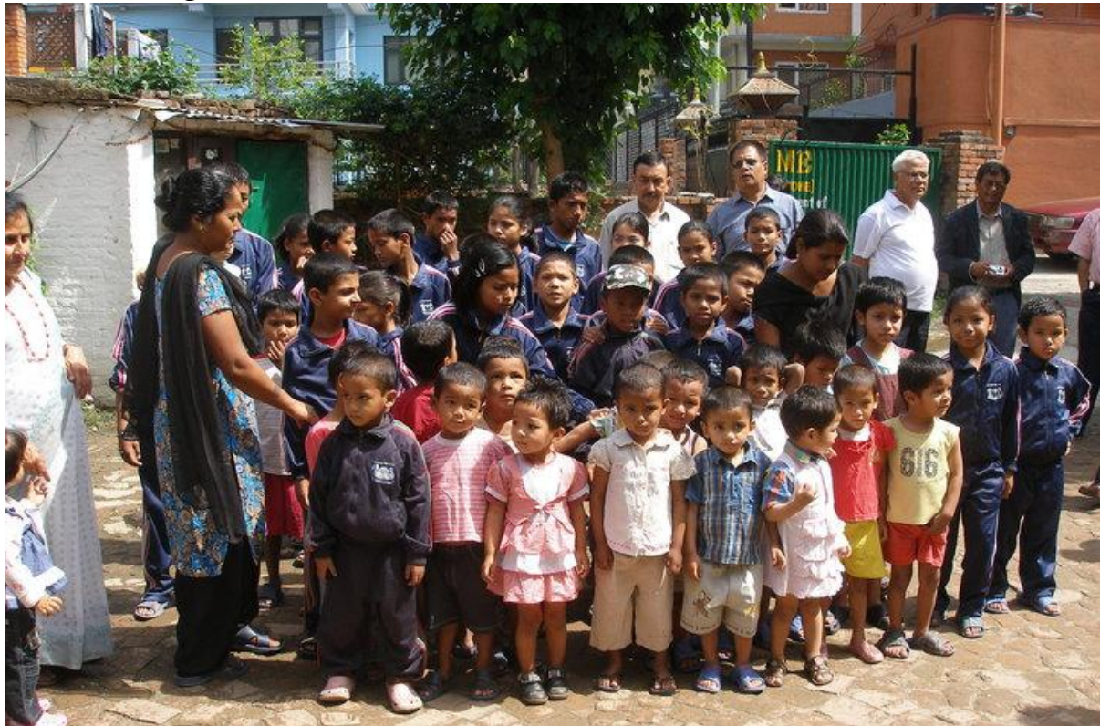
photo : les enfants de l'orphelinat

A ce jour, 19 enfants sont parrainés. 1 enfant a rencontré une nouvelle famille et n'a plus besoin d'être parrainé