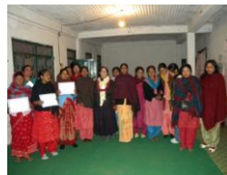
La formation est validée par un diplôme