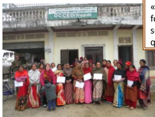
La formation a été validée par un diplôme

«Mon mari, au début, était contre ma participation à la formation mais maintenant il est très content que je l'ai suivie car j'ai appris des choses sur la culture des légumes que lui ne connaissait pas. Son regard sur moi a changé... »